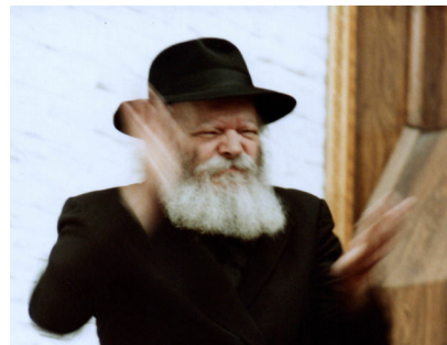
לך כנוס את כל היהודים הרבי שליט"א מלך המשיח מעודד את השמחה בכינוס ילדים שנערך בסמיכות לחג הפורים

הגזירה האימה הייתה חד-משמעית: "להשמיד, להרוג ולאבד את כל היהודים, מנער ועד זקן, טף ונשים ביום אחד"... המתח היה איום. החותמת המלכותית שנוספה לצו הבהירה באופן חד-משמעי שאין אפשרות לבטל את הגזירה האימה והנוראה!