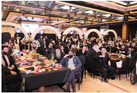
חלק מהקהל בהתוועדות