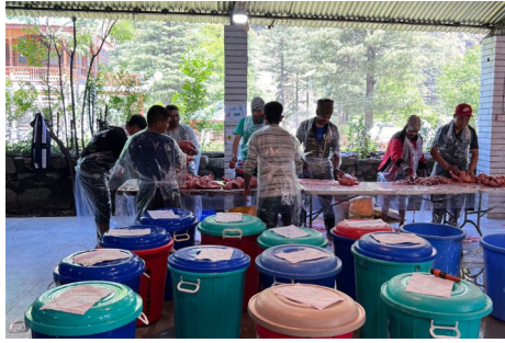
בהכנת אלפי עופות כשרים ליהודים מטיילים בהודו

כאשר ניצבים אנו בזמן המיוחד, על סף הגאולה האמיתית והשלימה, מוגשת חשיבות "מבצע הכשרות", לצד ההקפדה על חשיפת התינוקות והילדים לבעלי חיים טהורים בלבד, שלב מכריע לקראת המעבר לעולם בו לא יהיה רע כלל, וכל הטומאה תעלם, כנאמר "ואת רוח הטומאה אעביר מן הארץ", וכפי שכולנו נראה זאת, תיכף ומיד ממש, בהתגלות הרבי שליט"א מלך המשיח, בגאולה האמיתית והשלימה, עכשיו - נאו. ■