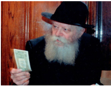
הרבי שליט"א מלך המשיח