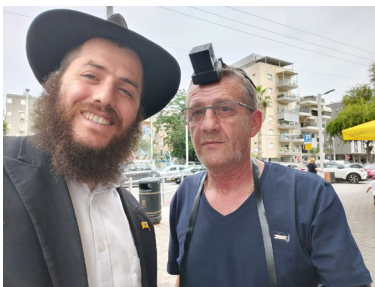
בדוכן הנחת התפילין

"אני לא מבין למה צריך לבדוק את המזוזות שוב? הרי רק עכשיו בדקנו אותם!". בעל הבית התפלא מאוד על התשובה שקיבל כעת באגרות הקודש.