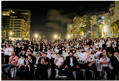
חוגגים גאולה.