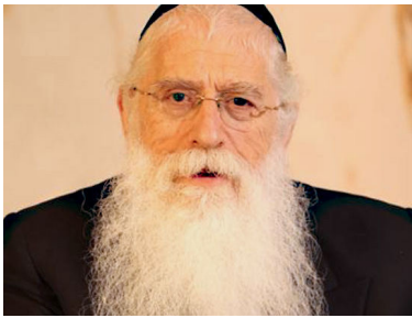
הרב מאיר פרוש