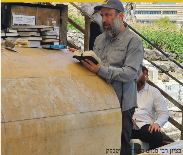
בציון רבי מנחם מייזנבוים זי"ע