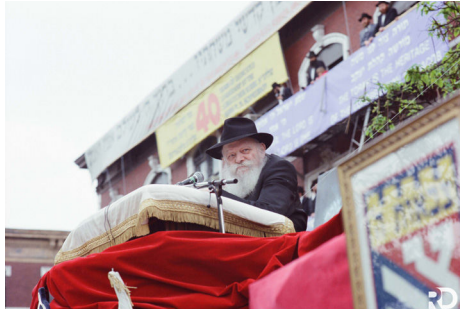
הרבי שליט"א מלך המשיח ב'פארד' של ל"ג בעומר