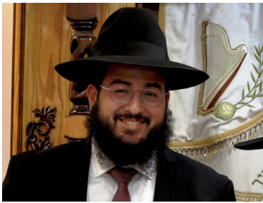
הרב שניאור מימון

סיפר מזכירו של הרבי שליט"א מליובאוויטש מלך המשיח, הרב יהודה לייב גרונר: באחד הימים, התקשר למזכירות קצין בצה"ל וביקש להעביר לרבי שליט"א מלך המשיח את הדיווח הבא: באחת ההזדמנויות, ראו לפתע חיילי צה"ל שעמדו בעמדת תצפית ישראלית, כיצד כל החיילים בעמדה המצרית שמולם מתחילים לפתע לנוס על נפשם. מפקד העמדה הישראלית הורה מיד לרדוף אחרי חיילי האוייב ולתפוס את כולם. החיילים השיגו אותם ולקחו את כולם בשבי. ביניהם היה גם קצין בכיר בדרגת סגן אלוף.