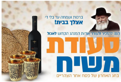
מנשר פרסומי על סעודת משיח

ביום שביעי של פסח - כ"א ניסן (29.04) ובחול"ל למחרת, לפני שקיעת החמה נוטלים ידיים לסעודת משיח. עדיף לחגוג את הסעודה ברוב עם הדרת מלך - במוקדי חב"ד, באופן שישיע על חיזוק האמונה. שותים ארבע כוסות יין (או מיץ ענבים) ומכוונים לכבוד הגאולה. וכמובן מדברים על הגאולה האמיתית והשלימה ונבואת הרבי שליט"א מלך המשיח. ■