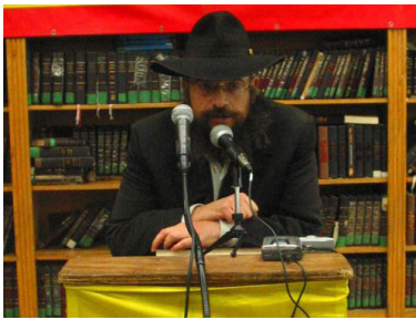
הרב צבי ונטורה

הם פנו לשאול את הרופא מה דעתו במצב הנוכחי ובגלל שהרופא הביע את חששו, רוצה הוא לשאול בעצת הרבי שליט"א מלך המשיח האם כדאי לשאול עוד רופא