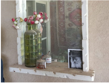
התמונה בפתח הבית. הצלה מעל הטבע

המחבלים הגיעו לרחוב בו מתגוררת גברת וויינשטיין. הם החלו להיכנס לבתים. בית ראשון, בית שני, והנה, תיכף הם מגיעים לבית שלה... היא ממתינה בחדרה גוברת