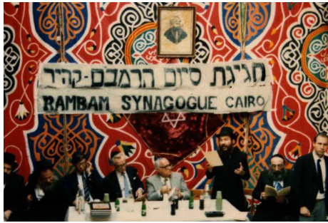
מגילת סיום הרמב"ם בשנים עברו, במצרים

אמרו חז"ל על הפסוק "ליהודים היתה אורה" – "זו תורה". אין ספק שבסיום המחזור השלושים ושלש, שמתקיים יום לאחר שושן פורים, ניתנת הזדמנות מיוחדת לכל אחד ואחת להצטרף ללימוד הרמב"ם, לימוד המביא ומרזז את הגאולה האמיתית והשלימה, תיכף ומיד ממש. ■