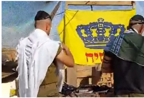
דוכן תפילין בעזה בימי המערכה הנוכחית