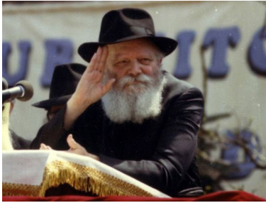
כתבים לרבי שליט"א מלך המשיח