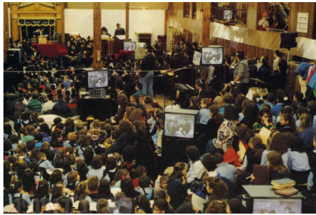
המסכים בבית המדרש של 770 בעת השידור החי

יצויין כי בחלק מאירועי העבר, ההדלקה בירושלים על ידי הכותל המערבי נעשתה בידי הרב מרדכי אליהו, כאשר הוא מקדים בדברי הערכה לרבי שליט"א מלך המשיח.