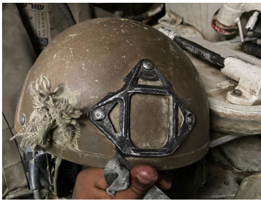
קסדת הנס. בצד נראה החלק שנפתח