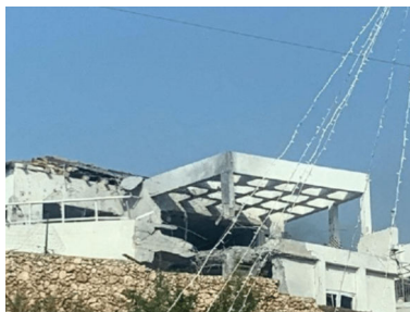
הפגיעה שריסקה את הבית באלפי מנשה

לצד כל האירועים הקשים שאירעו, נחשפים גם מספר עצום של מופתים וניסים המתחוללים מידי יום.