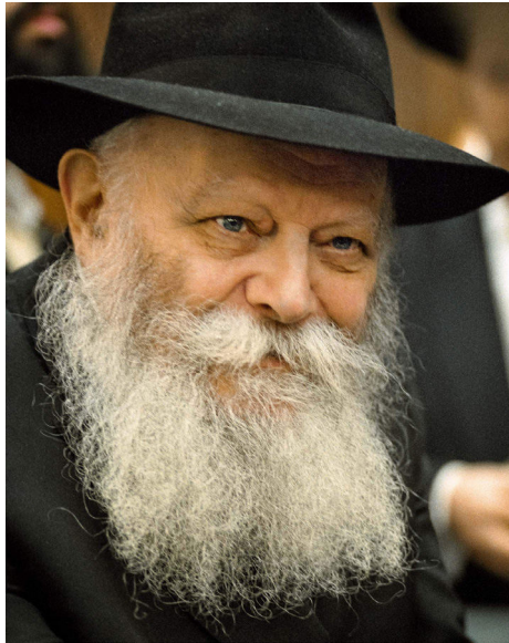
הרבי שליט"א מלך המשיח