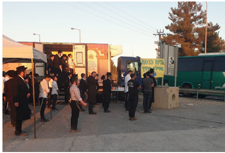
המתפללים גודשים את המקום

והסיפורים מתגלגלים... אדם שנכנס בוכה שהיום יום האזכרה לאביו והוא חשש להפסיד תפילה במניין, מגלה את בית הכנסת באמצע הדרך. אדם אחר שלא רצה לפספס הנחת תפילין גילה אותנו ממש ברגע האחרון לפני השקיעה, ועוד. ממש לפני כמה דקות חוייתי עוד נס, הוא מסיים את סיפורו, הגבאי היה צריך לקבל את המשכורת שלו, ולא ידעתי מאיפה יהיה את הכסף, רצייתי לשאול אותו אם זה בסדר לעכב את התשלום בכמה ימים, אך, ממש כעת קיבלתי שיחת טלפון בה הודיעו לי על תרומה של אלפיים ש"ח. כמובן שכל התפילות והברכות במקום מוקדשים לזיורו הגאולה האמיתית והשלימה, בקרוב ממש". ■