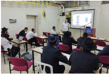
אחד משיעורי הקורס