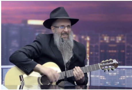
מתארח בתכנית 'השראה יומית' אצל הרב יצחק פנגר

הייתה לי עבודה טובה וקבועה והכל היה נראה מושלם, אבל דווקא אז התחילו להציק לי שאלות מהותיות: לשם מה באתי לעולם? מה התכלית של הבריאה? השאלות הללו לא הרפו ממני