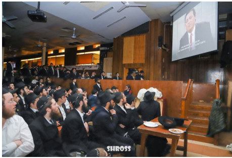
מאות צופים בסרט במהלך ההקרנה בניו יורק

הסרט התייעודי החדש הוקרן במספר מקומות, וגם פורסם באינטרנט. ניתן למצוא אותו באמצעות חיפוש המילים 'מאחורי הסאטעלייט'. הסרט מותיר רושם מיוחד על הצופים בו, אך כמו שאמר השבוע אחד המשתתפים בהקרנת הסרט: "העיקר זה לא להישאר בעמדת צופה אלא לנקוט פעולה מעשית. הסרט מדגיש עד כמה נחוצה הפעולה של הכתרת המלך, וכיצד הרבי שליט"א מלך המשיח נותן לה 'אור ירוק' ומעודד אותה. תם זמן השאנונות. העם צריכים להכתיר את המלך ולהכריז: יחי המלך המשיח!"