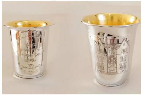
גביעים עם תבליט 770 והכרזת 'יחי אדוננו'

קראו לחוקר בכיר, שאמר לו לבסוף: 'קח את הדברים שלך ותתקדם'. "דחפתי הכל בחוסר סדר לתיקים, בגדים עם כלי צורפות, העיקר כדי לצאת משם כמה שיותר מהר", הוא נזכר. כעבור יומיים נזכר בהבטחה להיכנס לבית כנסת. הוא מגיע ממשפחה מסורתית בה שמרו את חג הפסח ויום כיפור, אך לא מעבר לכך. הוא לא הכיר כמעט דבר ביהדות. הוא יצא לרחוב והחל לחפש בית כנסת, ולבסוף לאחר הליכה ארוכה מצא את מבוקשו. היתה זו שעת צהריים והבנין היה ריק. "פגשתי שם יהודי אחד דובר עברית ואמרתי לו שאני רוצה להתפלל. הוא נתן לי סידור, ואני נעמדתי באיזו פינה בבית הכנסת הענק והתחלתי להתפלל ולבכות. לא הבנתי למה. אמרתי לעצמי 'הייתי צריך להתרחק עשרת אלפים ק"מ מהבית כדי להיכנס לבית כנסת? ומאז התחלתי להתקרב לדרך התורה והמצוות".