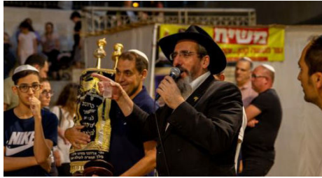
הרב מנחם באירוע הקפות שניות

ספר 'תורתו של משיח' שהוא למעשה האנציקלופדיה של שיחות הרבי שליט"א מלך המשיח בנושא מאותה תקופה. לא ידעתי האם עלי להמשיך בתחום ההוצאה לאור או שמא עלי לפתוח בית חב"ד ולהיות שליח. הפניתי את השאלה לרבי שליט"א מלך המשיח, שפסק - שניהם. זו היתה הפתעה. איך אפשר לשלב את שני התחומים, גם לנהל בית חב"ד וגם להקדיש זמן למלאכת ההוצאה לאור? עד היום אני לא יודע את התשובה, אבל עובדה שזה עובד.