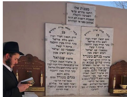
אצל רבותינו בליובאוויטש חסיד נושא תפילה על ידי ציונם של הרבי הצמח-צדק ובנו הרבי המהר"ש בליובאוויטש

אחד הסיפורים המאפיינים זאת באישיותו הפלאית, עוסק בנסיעתו לפריז, עם