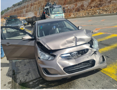
הרכב המרוסק לאחר התאונה

גם בפעם הזאת, כמו באין ספור פעמים לפניה, הוכח שוב שקיום הוראותיו של הרבי שליט"א מלך המשיח מביאים לשמירה והצלה מיוחדת, גם כשזה לא הגיוני בדרך הטבע