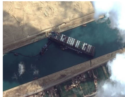
'פקק' בתעלת המים יוצר תגובה עולמית האוניה אבר גיבן תקועה לרוחב תעלת סואץ ומשפיעה בבת אחת על כל העולם כולו

שליט"א מלך המשיח בשיחתו הידועה באור לכ"ח ניסן תנש"א: "הדבר היחידי שיכולני לעשות - למסור הענין אליכם: עשו כל אשר ביכולתכם - ענינים שהם באופן דאורות דתוהו, אבל, בכלים דתיקון - להביא בפועל את משיח צדקנו ותיכף ומיד ממש!". ובהמשך אותה שיחה אומר: "ויהי רצון שימצא מכם אחד, שנים, שלשה, שיטכסו עצה מה לעשות וכיצד לעשות, ועוד והוא העיקר - שיפעלו שתהי' הגאולה האמיתית והשלימה בפועל ממש, תיכף ומיד ממש, ומתוך שמחה וטוב לבב."