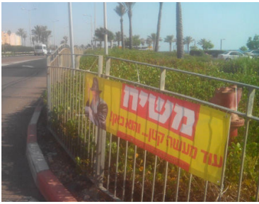
שלט פרסום משיח. צילום ארכיון