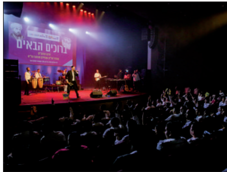
סיום הרמב"ם וגאולה.