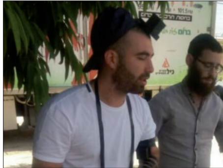
עומר אדם מניח תפילין

מרכיב עיקרי בהפצת ה'מבצעים' הוא פרסום בכל דרך אפשרית, בין היתר באמצעות קיומם על ידי אישי ציבור ידועים - אשר אז, בנוסף לעצם זיכויים בקיום המצוות החשובות - כשמצלמים אותם בעת הנחת התפילין, הדלקת הנרות, קביעת המזוזה וכדו' ומפרסמים את תמונותיהם בעיתונות, בתקשורת וכו' - מצליחים להשפיע ולהביא את ה'מבצעים'