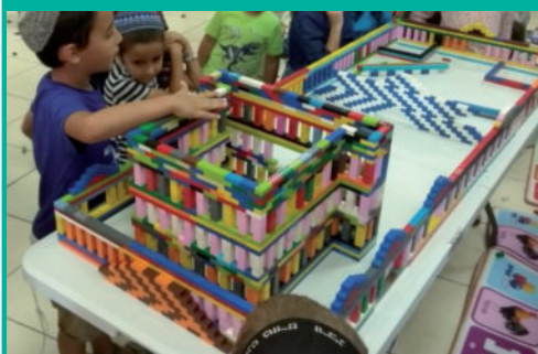
בפעילות בית חב"ד בניצן, השתתפו גם ילדי משפחות המגורשים מגוש קטיף, בבנין בית המקדש מלגו, בצפייה לראותו בקרוב ממש