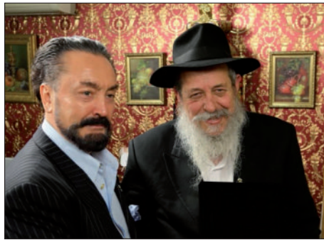
בפגישה עם השיח עדנן אוקטר

השייח עדנן אוקטר אמר שמעולם לא יצא מטורקיה וכשיבוא המשיח הוא יבא גם כן לירושלים... בקרוב ממש, אמן.