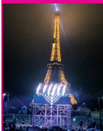
אלפי יהודים התאספו למרגלות מגדל האיפל המפורסם בפריז, צרפת, למעמד הדלקת נרות