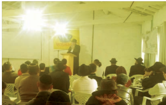
הרצאה בסמינר 7 מצוות באתר הנופש בברזיל

עוד ביטוי לתחילת קיומם של יעודי הגאולה, וכלשון הנביא: "כי אז אהפוך אל העמים שפה ברורה, לקרוא כולם בשם ה', לעובדו שכם אחד"