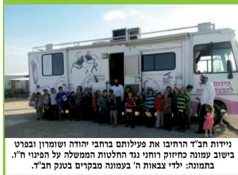
ניידות חב"ד הרכיבו את פעילותם ברחבי יהודה ושומרון ובפרט ביישוב עמונה כחיוק רוחני נגד החלטות הממשלה על הפינוי ח'ו. בתמונה: ילדי צבאות ה' בעמונה מבקרים בסנק חב"ד.