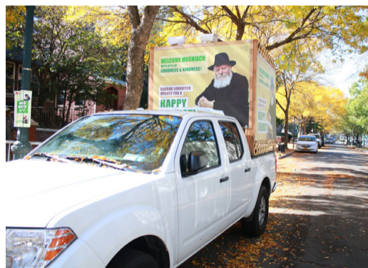
נערכים עם הסוכות הניידות

עם סיום התפילה, יצאו השלוחים למקומות הומים, על מנת לזכות את הרבים בשמיעת קול השופר, כשגם