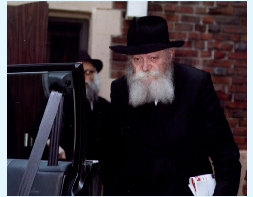
הרבי שליט"א מלך המשיח אחז את עיתון הגאולה גליון מס' 2