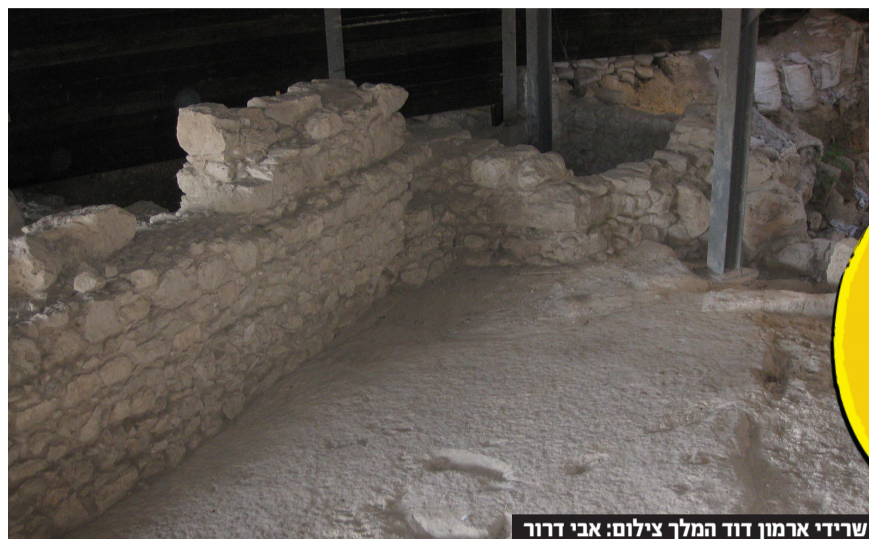
שרידי ארמון דוד המלך

כדי שאוכל להציל אתכם, בחרו בי למלך - כלומר, הרשו לי להמשיך לקיים אתכם ולצוות לכם את כל הטוב שיש לי. גאולה אמיתית ושלמה ששמרתי מאז - בשבילכם.