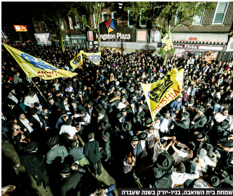
שמחת בית השואבה, בניו-יורק בשנה שעברה

ואם אתם לא שם, איך תעשו את הדבר החשוב הזה? אז ברחבי הארץ יש מאות נקודות בהן מתקיימים ריקודי שמחת בית השואבה בלילות החג. האירועים נערכים עם אמנים, הפעלות לילדים, כיבוד עשיר והפתעות נוספות. פנו לבית חב"ד הקרוב לאזור מגוריכם ובררו מתי והיכן תוכלו גם אתם לשאוב קדושה לכל השנה. עבורנו, בתקופה זו, השמחה והריקודים מתבקשים, כאשר אנו יודעים על הכנתו הנבואית של הרבי מלך המשיח שליט"א, כי בקרוב ממש תגיע הגאולה השלימה, ושוב נרקוד עם כל עם ישראל בחצר המקדש.