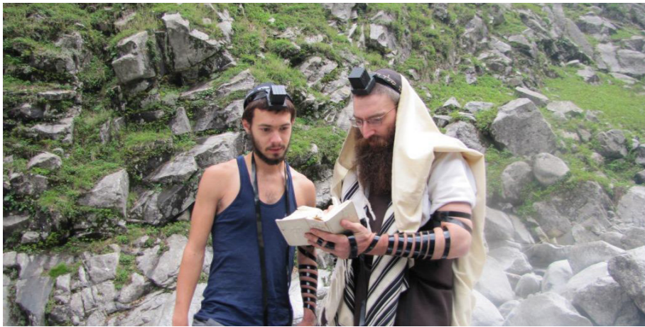
יהדות בכל מקום. שליח ומטייל ישראלי בתפילת שחרית משותפת בהודו

מפעל השליחות המסועף עליו מפקד הרבי שליט"א מלך המשיח, מעורר התפעלות והערכה בקרב יהודים מכל הגוונים • אך פהו הדחף והמנוע שגורם לו לשלוח אותם למקומות האלה, ולהם להפריא לקצה הגלובוס עם חיוך על הפנים? • הסוד, שמאחורי התופעה הכי מרגשת בגלובוס היהודי.