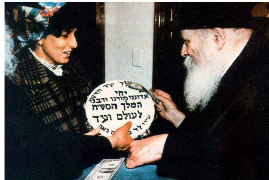
מקבל בברכה תוף פיזוד שהכינו נשות חב"ד בניו יורק לכבוד הגאולה

צעדים פשוטים אלו, הם לחיצות הכפתור הקטנות שלנו, המשנות את פני ההיסטוריה.