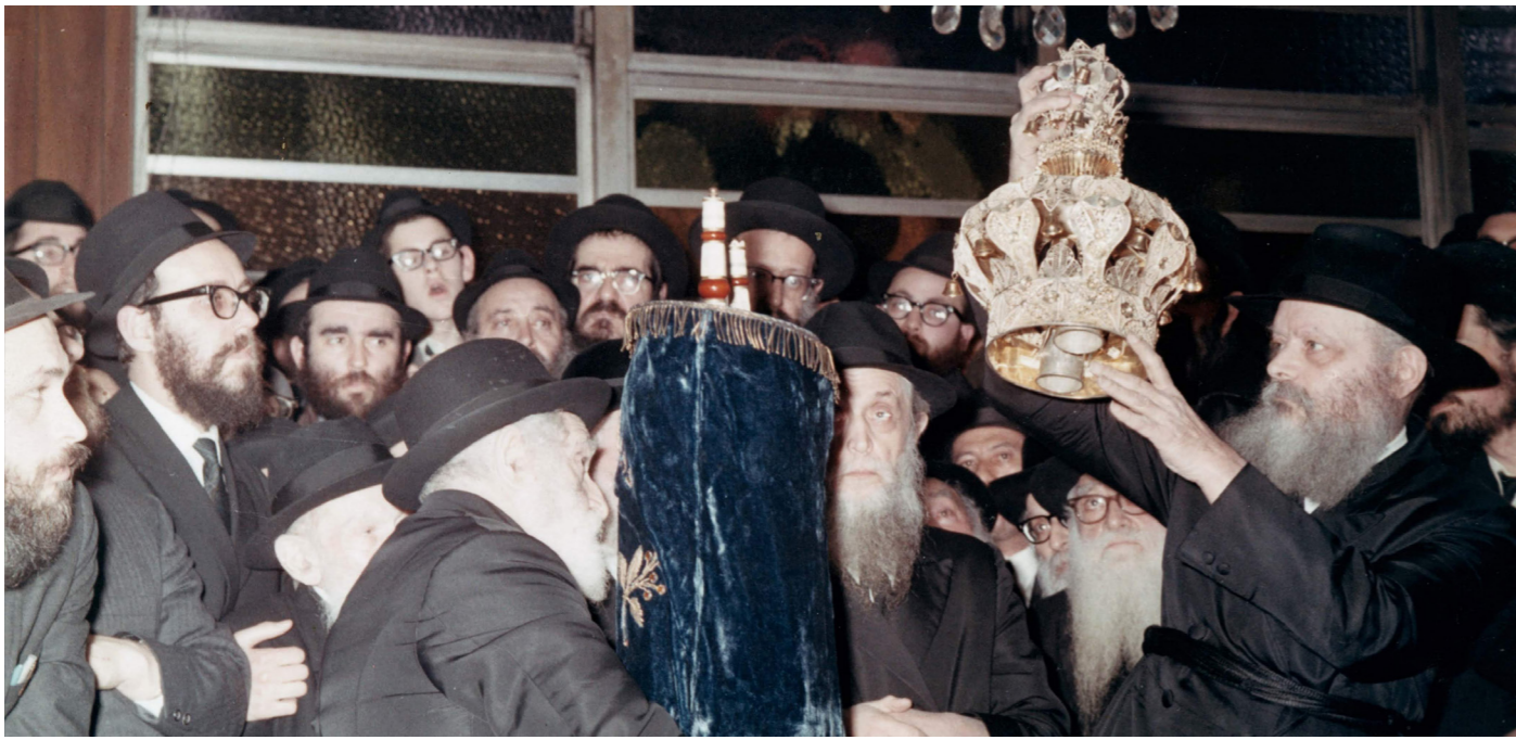
בניח את הכתר על ספר התורה הניחוד לקבלת משיח תורה 1970 - י"ד שבט תש"ל

בשעה הראשונה לעלותו על כסא הנהגת התנועה הציב הרבי שליט"א פליובאוויטש מלך המשיח יעד ומטרה שנראו דמיוניים. היום, שבעים שנה אחרי, אנחנו כאן כדי לספר, להבין ולהיות חלק. באתי לגני.