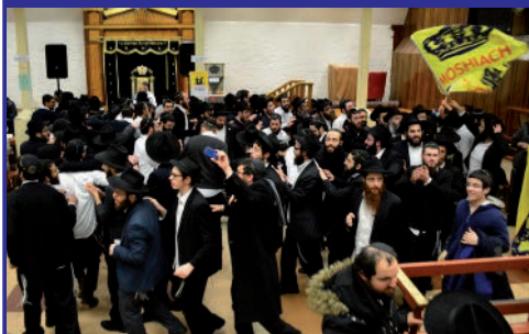
שישים יום של שמחה ב-770. מטה שירה זמרה, מארגן כמידי שנה יריקות מדי ערב בחודשי אדר, על פי הוראת הרבי שליט"א מלך המשיח

ואינו רואה בו סיפור עכשווי, הרי שהוא לא יצא מחובתו, עדיין נותר במצבו העגום. יש לראות בסיפור המגילה, את משמעותו העכשווית.