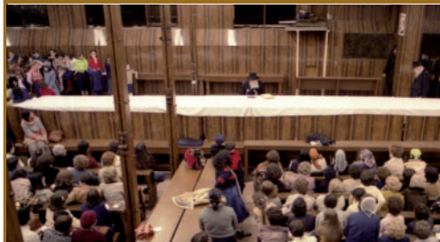
כמידי שנה נוהג הרבי שליט"א מלך המשיח לפני חג השבועות - מתן תורה, לומר שיחה לנשים. חיוק בעיני יהדות חסידות וענייני הגאולה.

בשיחותיו הקדושות מעורר הרבי שליט"א מלך המשיח את תשומת לבנו לעניין שאינו הוגן לכאורה, בהליך זה של ספירת בני ישראל. בתהליך הספירה נמנה כל יהודי כאחד ולא יותר, וללא כל התייחסות לדרגתו האישית ולהשיגיו בתורה, מצוות ועבודת ה', מדוע לכאורה אין נותנים ביטוי לערך האישי וליחודיות שבכל אחד?