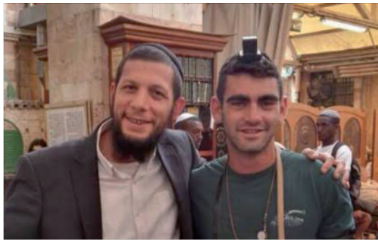
הרב יונתן עטיה

נסיתי להסביר לו שזה מתאים ליהודי ואלו הוא כגוי זה לא בשבילו. ואז לפתע הוא ואמר לי "אבל אמא שלי הייתה יהודיה". לרגע הייתי במעין הלם. אך מיד עניתי לו "אם כך, אתה הרי יהודי. בוא בהחלט ותניח תפילין". שלפתי אותו מתוך 300 הגויים להנחת תפילין. גאולה ממש.