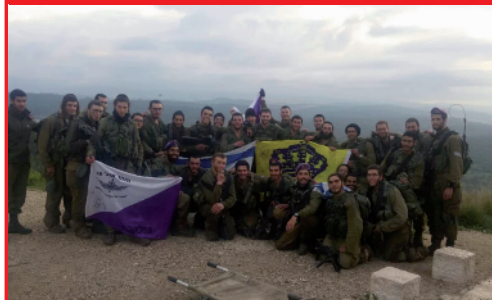
זועקים לגאולה האמיתית והשלמה בכל מקום. גם במסע של הנח"ל החודי: החיילים מצטלמים עם דגל חטיבת גבעתי ועם דגל משיח.

לאירועים בעולמנו הגשמי. שינוי הראיה נכון ועוד יותר, בכל הקשור ללימוד התורה, לגלות בכל עניין בתורה את הרובד הפנימי. לקחת את הטוב הנסתר ולעשותו לטוב גלוי.