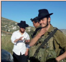
חייל במדי חב"ד...

אני עושה את החישוב, באתי לפה לשליחות, אז נו קדימה ל"מבצעים". מניח את התיק, מניף את הדגל בידי הימנית, ביד השניה נרתיק התפלין ומתחיל לזכות חיילים הנכנסים ויוצאים. רכבים צבאיים עוברים על ידי, הנהגים קולטים את הדגל, מסתכלים עליי ואני מחזיר להם את תנועת העידוד המפורסמת של הרבי שליט"א מלך המשיח. הם מחייכים.