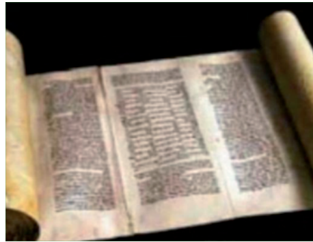
ספר התורה העתיק

ובמיוחד בשער טיטוס ברומא המנסה להנציח את גלות יהודה. גם כאן בולטת המשמעות החינוכית, בפרט שהמנורה "עדות הוא לכל באי עולם שהשכינה שורה בישראל". ותתגלה בבית המקדש השלישי בקרוב ממש.