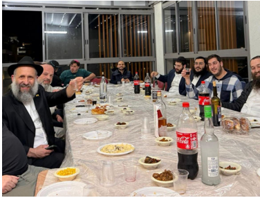
מתוועדים בשכונת נרקיסיים

הבית היה מוכן לפסח, והוא יצא לקניות לקראת החג עם הילדים. לפתע, שוטר תנועה עצר אותו, והשוטר עמד לקנוס אותו על שלא הושיב את בתו במושב בטיחות לילדים