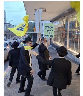
רוקדים בשמחה ברחובות

בתוך חודשים ספורים הפך הרב גרומך לדמות מוכרת ואהובה ביישוב, ולאחר מכן