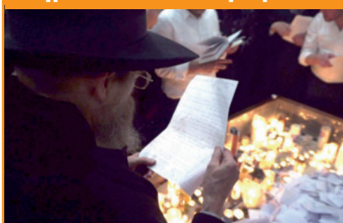
מעמד הקראת פסק דין, לזיכרון התגלות הרבי שליט"א מלך המשיח, ע"י רבני מכון הלכה חב"ד מארץ הקודש, אצל אדמו"ר הזקן, ביום ההילולא.

מתקן האימונים בצאלים, הפך כבר מזמן לאתר שדידה של הבדואים, החל מכניסה לשטחי אש לגניבת חומרי נפץ וכלה בגניבות של מחשבים וציוד צבאי יקר ערך. השודדים הבידואים עושים שם כרצונם, בצהרי היום כמו בלילות, מול עיני החיילים העומדים חסרי אונים.