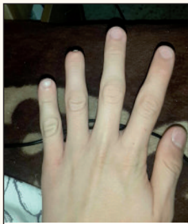
כף היד לאחר הטיפול

אימו טלי התקשרה לבית משיח ובקשה שיבוא לבדוק את המזוזות. ואכן ביום חמישי נגשתי לביתם לבדוק את המזוזות. ושמחתי לראות את הבתי מזוזות בגודל 20 ס"מ (בדרך כלל המזוזות בבתיים הם של 12 ס"מ) מפוארים מאוד מה שהעיד בעיני על מזוזות מהודרות הנמצאות בפנים.