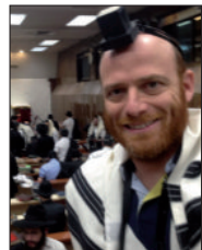
אצל הרבי שליט"א מה"מ

ככל דבר חי אנחנו משתדלים להוסיף ולהתקדם. לפני כשבועיים השתתפתי בהתוועדות הגדולה ה' טבת בכפר חב"ד ב' שנמשכה לתוך הלילה, במהלכה דובר על חשיבות הנחת התפילין רבינו-תם. למחרת קבלתי על עצמי בל"ג,