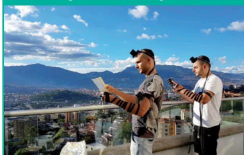
תורמילאים ישראלים בהנחת תפילין בבית חב"ד בעיר מדיג'ן במדינת קולמביה. מוקד נוסף בהפצת בשורת הגאולה באמריקה הלטינית.

אך כנגד כל כללי התרבות השלטונית, משה רבינו יוצא לראות במה יוכל לסייע לאחיו בני ישראל. "וירא בסבלותם", אומר המדרש "שהיה רואה בסבלותם ובוכה ואומר .. מי יתן מותי עליכם שאין לך מלאכה קשה ממלאכת הטיט, והיה נותן כתפיו ומסייע לכל אחד אחד מהן. ולא הסתפק בכך אלא כשראה כתפותיהם שהיו יורדות דם מן המשאות, והיה עושה להם רטיה על גבי המכה. ראה שהם מתים ומושלכים באשפות ואינם קוברים אותם ומשה ע"ה מטפל בהם וקוברן.