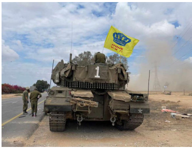
דגל משיח על טנק בעזה

המראות הקשים שראינו בחג שמחת תורה האחרון, החלו להתחלף למראות טובים ומעודדים יותר, תמונות של התגברות על אויבי ישראל, ובמיוחד - תמונות של ניסים שבורא כולם מחולל לעיני כל לטובת בניו.