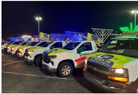
מראה הרכבים בניו יורק

הלילה השני הוקדש כולו לרובע מנהטן, לעורר ולהפיץ... בשיירה מרשימה ביותר חצו הרכבים הגדולים את גשר מנהטן, ונסעו בכל הרחובות המרכזיים של הרובע היוקרתי. אנשים רבים עצרו, צילמו ושאלו שאלות, במספר מוקדים אף עצרו הבחורים להדליק חנוכיה ולרקוד וזכו להתעניינות רבה של העוברים והשבים אשר חלקם היו יהודים שמיד קיבלו חנוכיות מהודרת בלידם, כשהם מתחזקים בבשורת הגאולה. ■