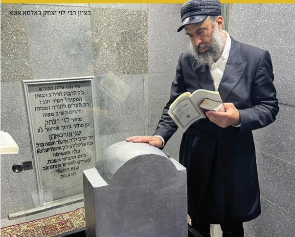
בציון רבי לוי יצחק באלמא אטא