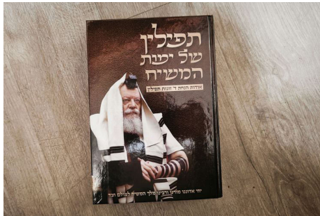
הספר במהדורה החדשה

מאז, צבר העניין תאוצה והתפרסם, במהלך השנים שלאחר מכן, עוד ועוד נחשפו לרעיון בלמדם את השיחות, וביקשו ללמוד יותר על העניין. כשפנו אל הרב ציק, התברר כי קיים מחסור בחומר לימודי מסודר, שיסביר את כל הנושא. לאחר ששאל את הרבי שליט"א מלך המשיח, וקיבל ברכה התחיל בכתיבת הספר, במשך מספר שנים.