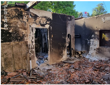
אחד הבתים השרופים בבארי