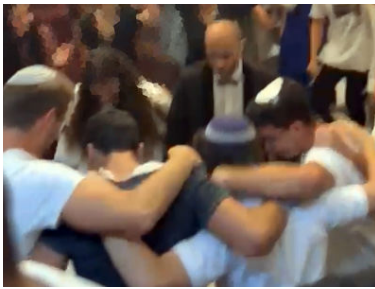
מתוך צילומי החתונה

בעוד הכלה עושה את ההכנות, היא פגשה כלות אחרות, המוקפות בבני משפחה צוהלים, ורק היא לבדה, ללא שום קרובת משפחה שתהיה איתה ברגעים החשובים בחייה