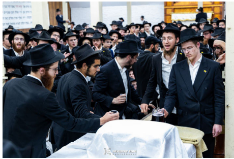
חלוקת 'כוס של ברכה' במוצאי ראש השנה

יצוין כי אירועים אלו, מושכים אליהם גם רבים מתושבי ניו יורק וגם תיירים רבים המגיעים לפקוד את ביתו של הרבי שליט"א מלך המשיח, 770 'בית משיח', שם נוא מקומו הנצחי של נשיא הדור, כפי שהוא בעצמו כתב בקונטרס 'בית רבינו שבבבל' עדי הגאולה האמיתית והשלמה, תיכף ומיד ממש. ■