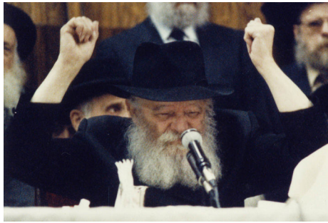
תיכף ומיד ממש

אין אנו מסתפקים בלאחל שבשנה הבאה יהיה טוב יותר, וברור שכך יהיה, אלא אנו דורשים את הכל - כאן, עכשיו ובמזומן. הגאולה האמיתית והשלימה עכשיו ממש!