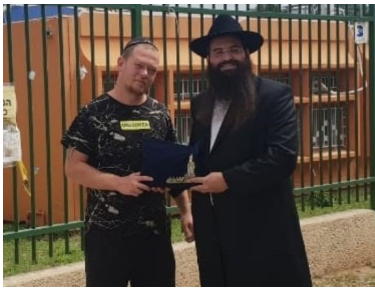
הרב בוטבול מעניק את התפילין

גם בפעם הזו, בעלי עמד על דעתו בתוקף שאסור לבנו הכהן להתחתן בחתונה האסורה על פי תורה, ואכן הלחץ עשה את שלו, והבן הודיע לבסוף שהוא יורד גם מהרעיון הזה