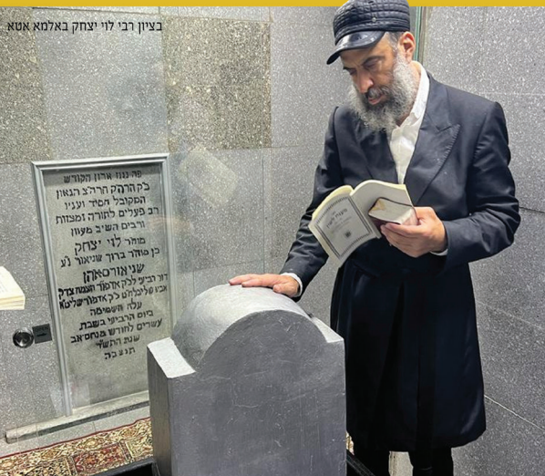
ביצון רבי לוי יצחק באלמא אטא