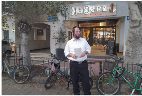
בחלוקת חומרי הסברה בכניסה לאירוע מיסיונרי

תחום נוסף בו פעיל הארגון הוא מניעת התבוללות, אשר נפוצה בקרב צעירות יהודיות שהולכות שולל אחרי ערבים, מנוצלות על ידם וסובלות. "חשוב לדעת כי זו תופעה רחבה שנוגעת גם בציבור הדתי / חרדי. יש לזכור את הנאמר כי "כל המציל נפש אחת מישראל - כאילו קיים עולם מלא". מאוד חשוב לפנות ולדווח כבר בהתחלה ולא לחכות להתבססות הקשר, מעבר לכפר, הולדת ילדים וכן הלאה. בנושא זה, מלבד פעילי השטח, פועלות בארגון גם עובדות סוציאליות, המעניקות את התמיכה הדרושה במצבים מורכבים".