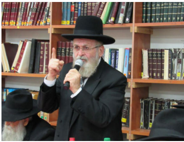
הרב יוסף ישר

חברתה לא הרפתה, ואמרה לה. מה אכפת לך לנסות? הלא רבים וטובים ראו ניסים ומופתים עצומים, בכל תחום בחיים. אני בטוחה שאם תעשי זאת, גם את תראי את התממשות הברכות