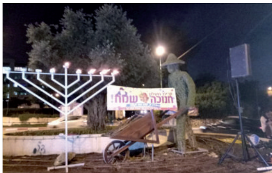
חנוכה ובשורת הגאולה בקרית מטלון

האירוע המוצלח עורר הדים טובים. "קבלנו לאחר מכן, מספר הרב שלום, תגובות חמות ביותר ממשפחות שהודו בכל פה על ההשפעה החיובית העצומה שיש למסיבות שבת אלו על הילדים ואף עליהם, על ההורים. כהבטחת הנביא לזמן הגאולה "והשיב לב אבות על בנים", בקרוב ממש"