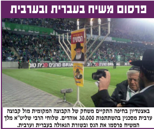
באצטדיון בחיפה התקיים משחק של הקבוצה המקומית מול קבוצה ערבית מסכנין בהשתתפות 30.000 אוהדים. שלוחי הרבי שליט"א מלך המשיח פרסמו את הנס ובשורת הגאולה בעברית וערבית.