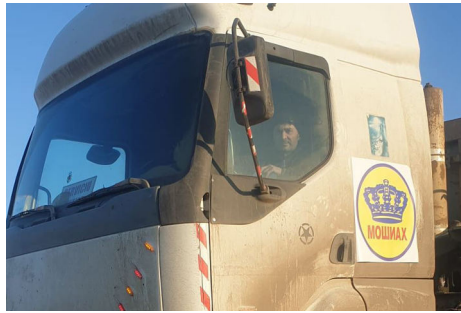
חליל קרבולוט, עם סמל משיח על משאיתו

וכפי שאומר הרבי שליט"א מלך המשיח ב'דבר מלכות': "מה יאמר העולם ומה יאמרו האומות על כך שיהודי עושה את עבודתו... בקירוב הגאולה האמיתית והשלמה, הרי אין הם מבינים מה פירוש הדבר? והמענה על זה הוא: העולם כבר מוכן! כאשר יהודי יעשה את עבודתו כדבעי... יראה איך שהעולם, טבע העולם ואומות העולם, מסייעים לו בעבודתו!".