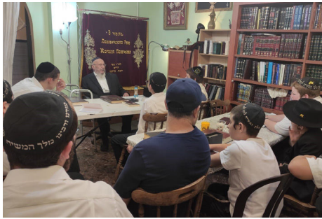
לומדים במכינה לישיבה