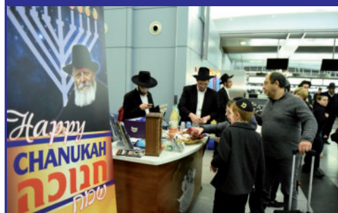
בית חב"ד בנמל התעופה ע"ש קנדי בניו יורק מעמיד דוכן המאפשר לטסים להדליק נרות חנוכה לקראת ההמראה.