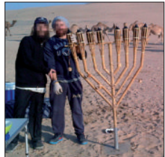
חנוכה בלב המדבר

לאחר ההדפסה לקחנו את הדפים לכריכה מהודרת בארץ.