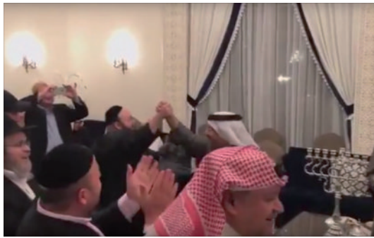
אור החנוכה בבחריין

ובביקור הבא חילקנו את ספרי התניא לחברי הקהילה, שנדהמו לשמוע על הדפסת התניא במדינה המוסלמית. אחד מאנשי הקהילה התלהב כל כך, עד שקבע עם מישהו מהארץ שיעור תניא באמצעות תוכנת הסקייפ... יפוצו מעינותיך חוצה, גם בנסיכויות הנפט.